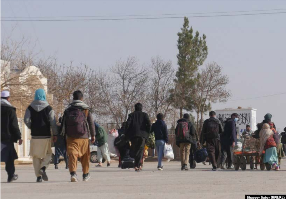
Shapoor Saber (RFE/RL)