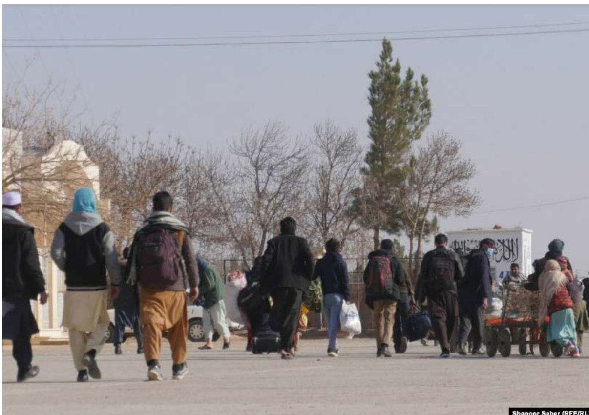
Shapoor Saber (RFE/RL)

از سوی دیگر، در ۱۱ نوامبر ۲۰۲۴، استخبارات طالبان یک نظامی سابق و برادرش را در ولایت غور بازداشت کرد. خانواده این دو فرد گفته‌اند که هیچ معلوماتی از سرنوشت آن‌ها و محل نگهداری‌شان ندارند و طالبان نیز دلیل بازداشت و اتهام آن‌ها را اعلام نکرده‌اند.