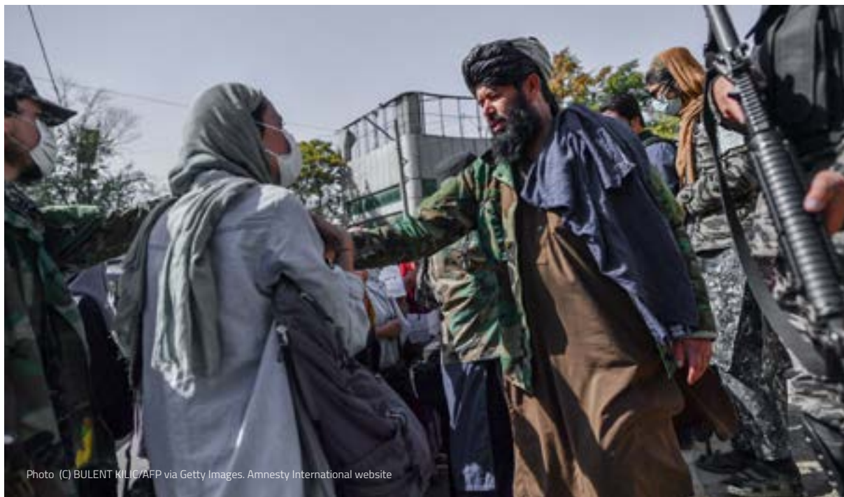
Photo (C) BULENT KILIC/AFP via Getty Images. Amnesty International website

یافته‌های این گزارش نشان داده است که در جریان سال ۲۰۲۳ دست‌کم ۶۲۳ تن به‌شمول ۵۵ زن در ۲۲ ولایت ۸ به‌صورت خودسرانه و غیر قانونی توسط طالبان بازداشت شده‌اند. افراد بازداشت شده شامل کارمندان حکومت پیشین اعم از ملکی و نظامی، افراد منسوب به نیروهای «خیزش مردمی» قبلی، فعالان حقوق بشر، خبرنگاران، علمای دینی، بزرگان قومی، افراد تجارت پیشه و مخالفان و منتقدان طالبان می‌باشند.